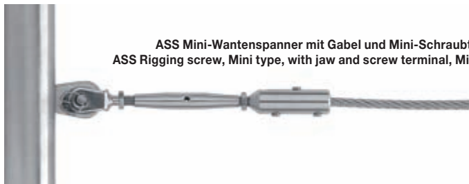
ASS Mini-Wantenspanner mit Gabel und Mini-Schraubterminal mit Außengewinde ASS Rigging screw, Mini type, with jaw and screw terminal, Mini type, with external screw thread